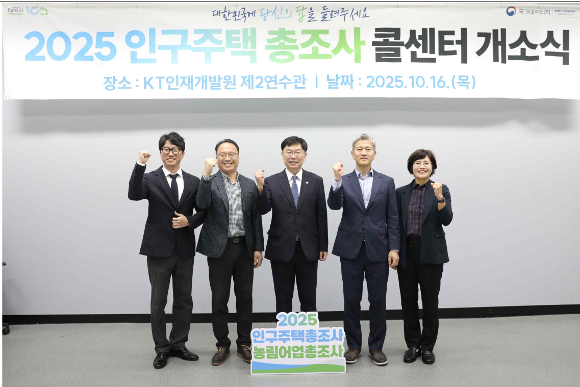
2025 인구주택총조사 콜센터 관계자 단체 사진(가운데 안형준 국가데이터처장)