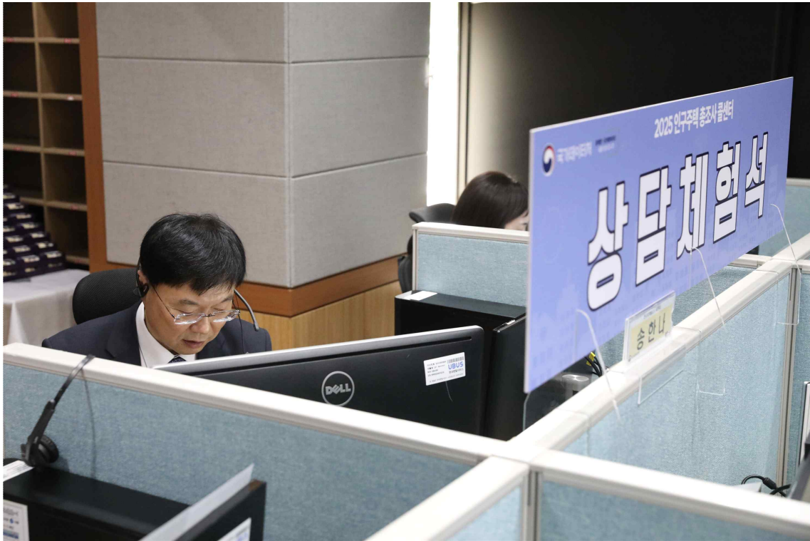
2025 인구주택총조사 콜센터에서 상담 시연 중인 안형준 국가데이터처장