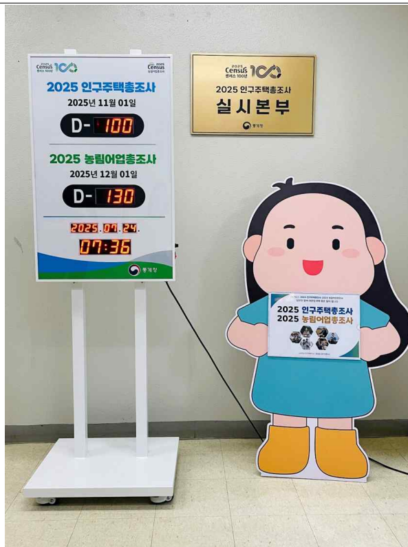
대전정부청사에 설치된 2025 인구주택총조사 디데이 카운트 시계